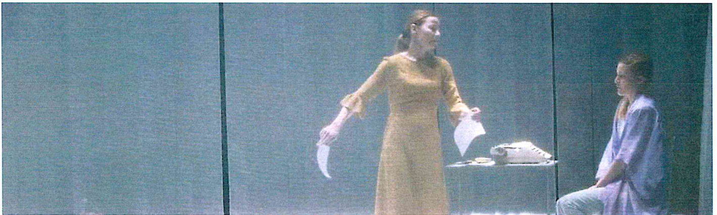
« La Ménagerie de verre » comme un rêve de glace