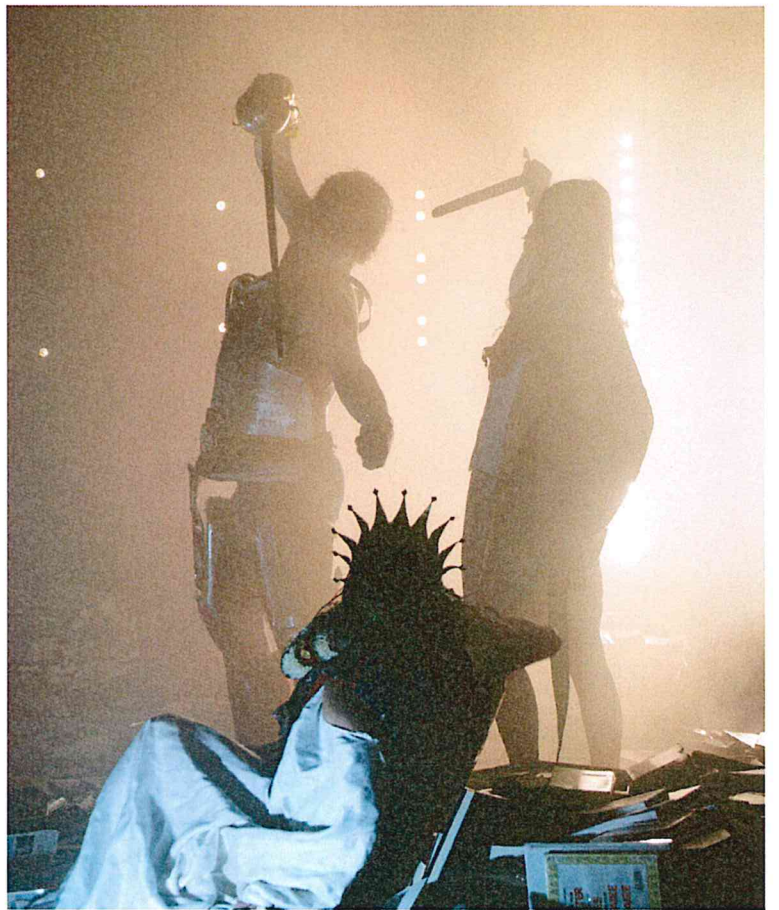
Photographies des répétitions, Le Volcan, Scène Nationale du Havre