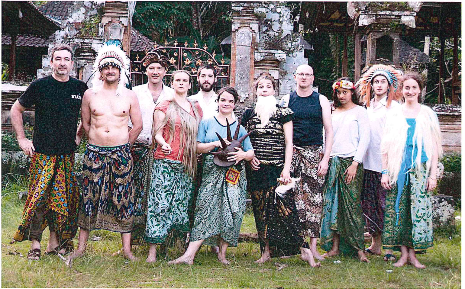
Equipe artistique et technique de TEMPÊTE , résidence à Bali - Indonésie avril/mai 2016