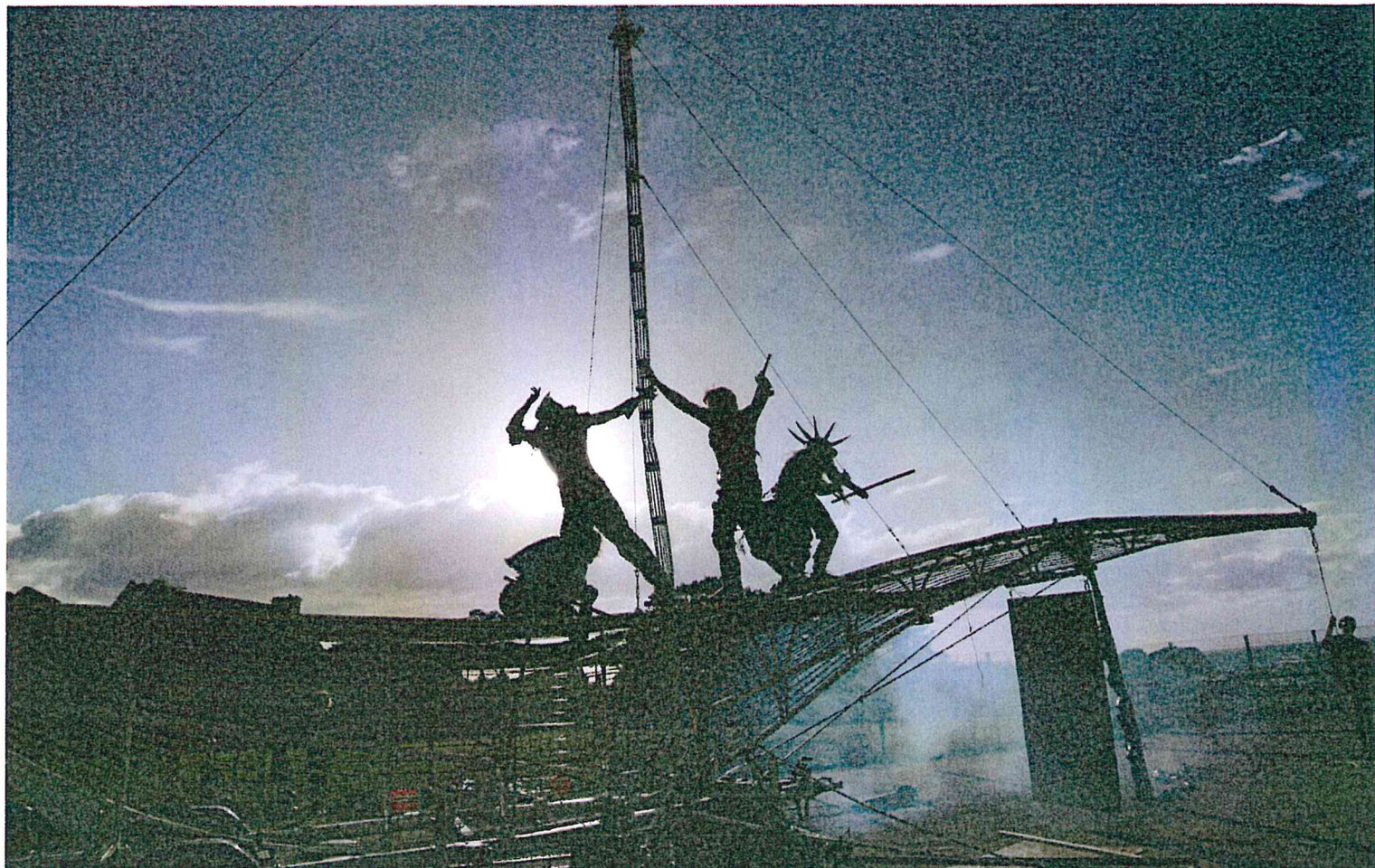
Photographie des répétitions de la 1ère partie du spectacle. Deuxième partie en salle.